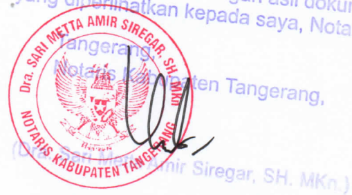
Foto copy ini sesuai dengan asli dokumen yang diperlihatkan kepada saya, Notaris.